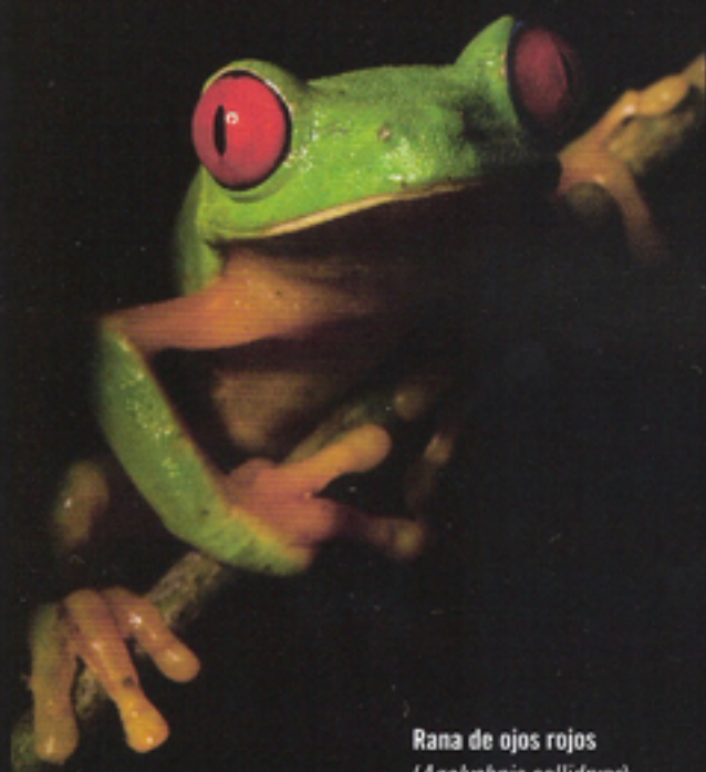
Rana de ojos rojos ( Agalychnis callidryas ), Reserva de la Biosfera Selva El Ocote, Chiapas.