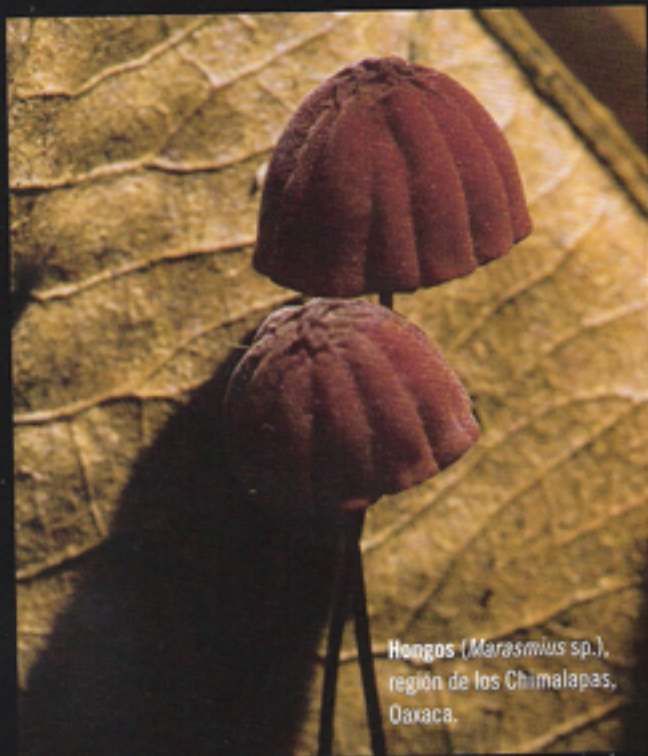
Hongos ( Marasmius sp.), región de los Chimalapas, Oaxaca.

Miguel Sicilia. Es biólogo por la Universidad Autónoma Metropolitana. Autodidacta en la fotografía de naturaleza, disciplina que representa su estilo de vida. Desde 2009, se dedica a capturar con su lente la inmensa riqueza natural de México para la Comisión Nacional para el Conocimiento y Uso de la Biodiversidad. Puedes ver más de sus fotografías en el Banco de Imágenes de CONABIO. www.biodiversidad.gob.mx