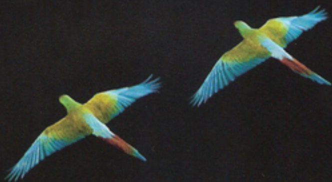
Guacamayas Verdes ( Ara militaris ), Cañón del Sabino, Reserva de la Biosfera Tehuacán-Cuicatlán, Puebla-Oaxaca.